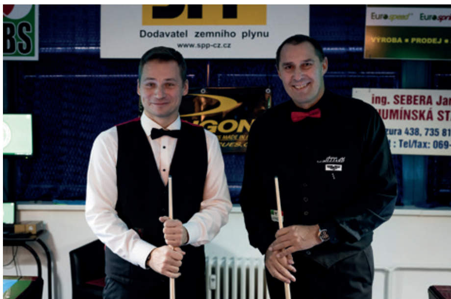
Přátelé a rivalové / Rivals & Friends