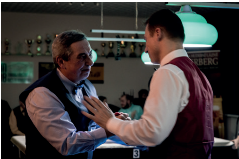
Přátelé a rivalové / Rivals & Friends