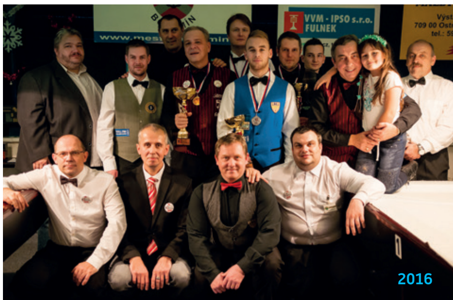
Tak šel čas / Past tournaments