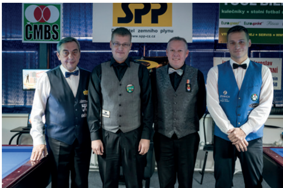
Přátelé a rivalové / Rivals & Friends